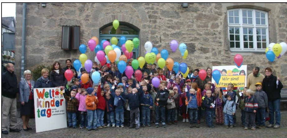
Kinder aller Städtischen Kitas am Weltkindertag im September 2010

Unsere Kitas sind familienergänzende Einrichtungen. Wir beraten und unterstützen Erziehungsberechtigte in Bezug auf die Entwicklung ihrer Kinder in gegenseitigem Vertrauen. Unsere Teams respektieren, akzeptieren und unterstützen einander in der täglichen pädagogischen Arbeit.